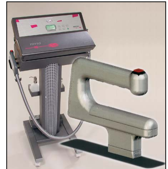
PCL-plus-System Gerät mit Handstück

Die Behandlung ist weitgehend schmerzlos. Man spürt nicht mehr als ein leichtes Ziehen und lokale Wärme.